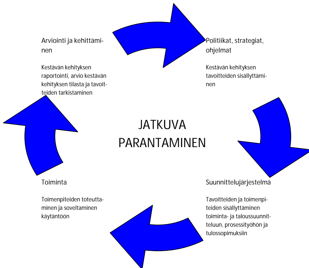
Kuva 1. Puolustushallinnon kestävän kehityksen jatkuvan parantamisen malli.

Kestävän kehityksen ohjelman toteutus jalkautetaan puolustushallinnon kaikkien toimijoiden vastuulle osaksi kaikkea toimintaa. Käytännön toteutus tapahtuu prosessimaisella työskenteilyllä ja yksittäisistä tavoitteista ja toimenpiteistä vastaavat asianomaiset ydin- ja alaprosessit. Yhteistyöverkosto esittää, että toimenpide-ehdotusten toimeenpano aloitetaan viipymättä resurssien sallimissa puitteissa. Ohjelman toteutukseen vaikuttavat resurssien lisäksi myös yhteiskunnallinen ja teknologinen kehitys.