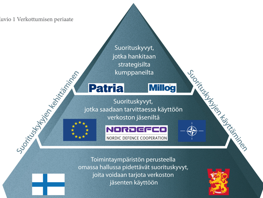
Kuvio 1 Verkottumisen periaate

Maanpuolustuksen tieteellisen neuvottelukunnan tutkimustoimintaa laajennetaan tukemaan myös hallinnonalan strategista suunnittelua. Tämän lisäksi tuetaan neuvottelukunnan toiminnan verkottumista laajempaan turvallisuustutkimuksen kehukseen. Neuvottelukunnan rahoitusta pyritään vahvistamaan ja verkoston innovoivaa roolia kehitetään.