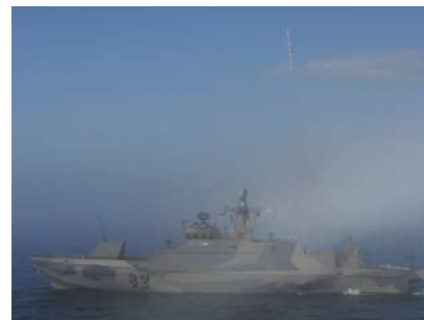
Merivoimien huippunykyaikaiset Hamina-luokan ohjusvenet on varustettu tehokkaalla eteläafrikkalaisella Umkhonto-ilmatorjuntaohjusjärjestelmällä.

Laaja-alaiset turvallisuusuhkat, eurooppalaiset yhdentymishaasteet ja tarve osallistua yhä vaativampaan kansainväliseen kriisinhallintaan edellyttävät puolustusvoimien henkilöstön osaamisen tason lisäämistä. Koska asevelvollisten lähtökoulutustaso on korkea, nykyisillä palvelusajoilla heidät voidaan kouluttaa vaativiinkin tehtäviin. Myös asevelvollisten koulutuksen tulee tähdätä ammattimaisempaan osaamiseen. Näin laadukasta henkilöstöä riittää rekrytoitavaksi myös kansainvälisiin kriisinhallintatehtäviin ja puolustusvoimien palkattuun henkilöstöön.