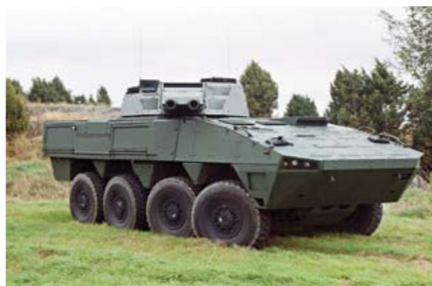
Valmiusprikaatit on varustettu modernilla aseistuksella. Esimerkkinä suomalaisvalmisteinen AMV AMOS-kranaatinheitinjärjestelmä.