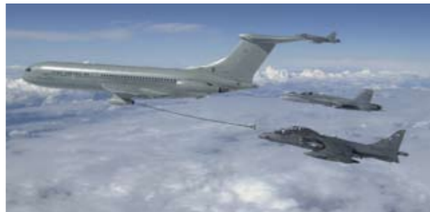
Ilmavoimilta edellytetään kansainvälistä yhteensopivuutta tulevaisuuden kriisinhallintaoperaatioissa. Kansalliseen puolustukseen hankittuja kykyjä voidaan käyttää myös kansainvälisissä tehtävissä.

Puolustusvoimien osaaminen, kalusto, infrastruktuuri ja tilannetiedot ovat hyvä tuki muille viranomaisille. Käytännössäkin tukea pyydetään enemmän ja velvoitteet viranomaistukeen ovat lisääntymässä niin kansallisessa lainsäädännössä kuin kansainvälisissä yhteistoimintavelvoitteissakin. Vuorovaikutusta viranomaisten välillä pitää kuitenkin parantaa toiminnan kaikilla tasoilla.