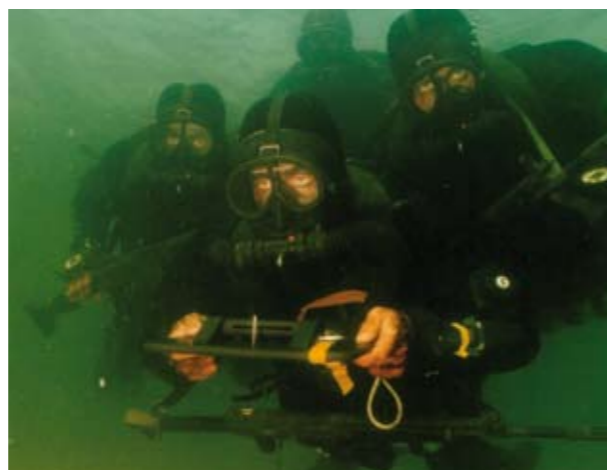
EU:n taisteluosastoihin voidaan tulevaisuudessa sijoittaa merivoimien erikoiskoulutuksen saaneita joukkoja, kuten sukeltajia.