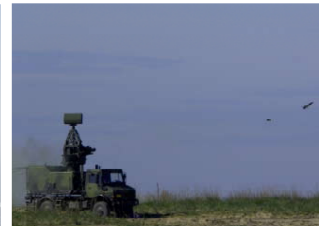
Ilmapuolustusta kehitetään tulevina vuosikymmeninä – laatu korvaa määrän ja osaaminen korostuu.