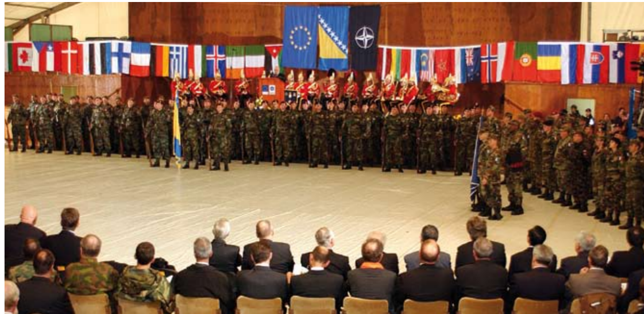
EU-NATO yhteistyö tiivistyy – kriisinhallinnan vetovastuu voi vaihtua organisaatiolta toiselle. Kuvassa on Nato-johtoisen Bosnia-operaation (SFOR) siirto EU:n johtoon ("Althea"-operaatio) joulukuussa 2004.

Nato uudistaa sotilaallista rooliaan voimakkaasti. Toiminta-alueetta ei enää rajata maantieteellisesti, vaan Natolle luodaan valmiudet toimia globaalisti siellä, missä tulevaisuuden uhkat saavat alkunsa.