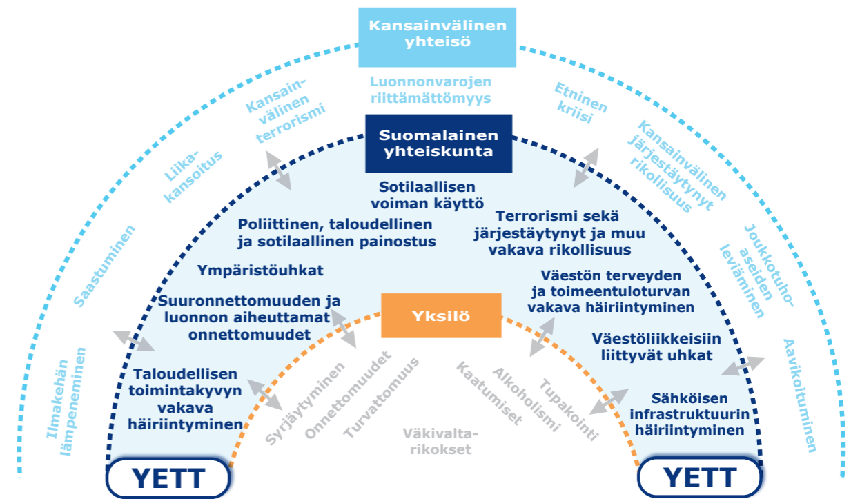
YETT = Yhteiskunnan elintärkeiden toimintojen turvaaminen