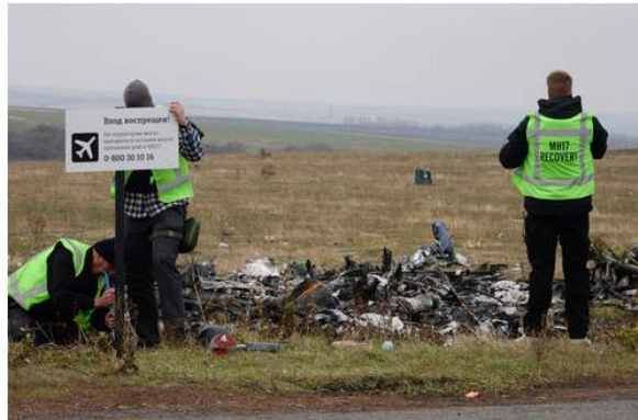
Kone hajosi pieniksi palasiksi.

Malesian matkalla ollut matkustajakone ammuttiin alas Ukrainassa pari vuotta sitten. Nyt BBC väittää, että koneen ampui alas ukrainalainen taistelukone.